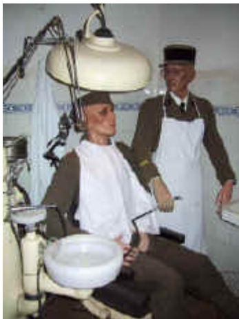
Cabinet dentaire du Fort Hackenberg – Ligne Maginot (à 20 km de Thionville en Moselle).

Le 11 novembre 1942, l'armée allemande envahit la zone libre, partie sud de la France. Le mois suivant, l'armée d'armistice est dissoute. Dès lors, le Service de santé de l'armée française n'existe plus. Le soutien médical a été confié pour toute la durée du conflit aux Britanniques et surtout aux Américains (Jamin, 2011). Nombre de dentistes démobilisés en 1940 entrent alors en Résistance, leurs cabinets dentaires servant de plaques tournantes pour l'échange d'informations. Beaucoup d'entre eux sont morts fusillés par la Gestapo (Pierre Audigé). D'autres ont été déportés et en sont revenus diminués (René Maheu). D'autres se sont engagés dans les forces françaises libres (Maurice Prochasson).