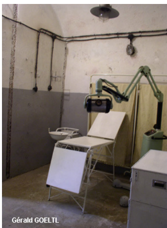
Cabinet dentaire du Four à Chaux dans les Vosges.