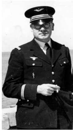
Maurice Prochasson (Musée de l'Ordre de la Libération, 2011).