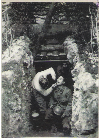
Un dentiste opère sur le seuil d'un poste de secours, © MSSA, 2006.