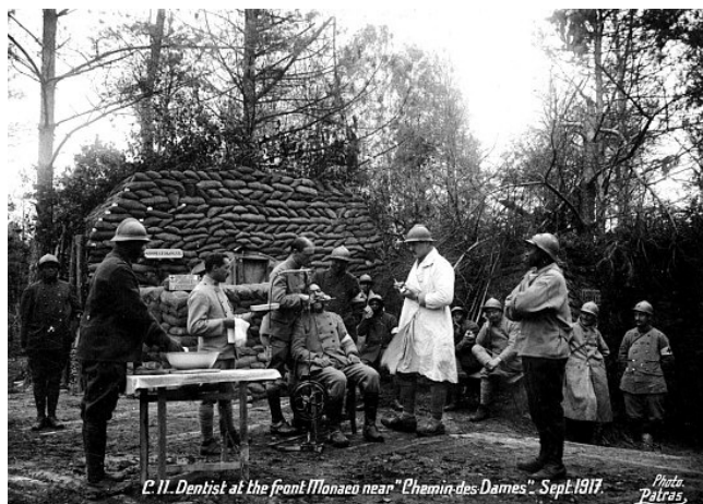
Dentiste au front, près du « Chemin des Dames » - Septembre 1917, © BNF, 2007.